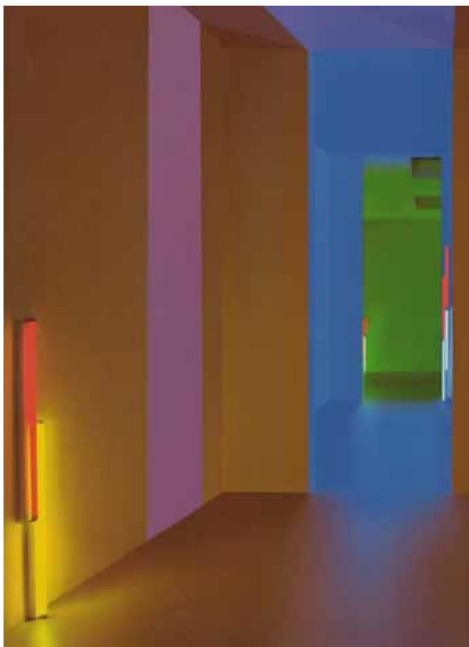
[1] Vista da instalação da exposição Dan Flavin: Series and Progressions na galeria David Zwirner, em Nova York, EUA, 2009

Flavin começou a usar a lâmpada fluorescente nua, desprovida de qualquer alteração, como único material para sua obra em 1963 e continuou até sua morte em 1996. Foram 33 anos experimentando o comportamento da luz que emana do tubo luminoso. O artista partiu de um único material – a lâmpada fluorescente – em poucas variações: cinco formatos (quatro tamanhos de tubos – 61, 122, 183 e 244 cm e um formato circular), seis cores (pink, amarelo, vermelho, verde, azul e ultravioleta) e quatro tons de branco (mor-