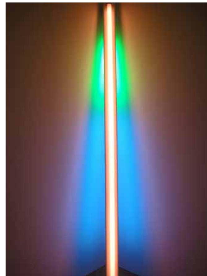
[2] untitled , 1976. Fluorescente pink 244 cm, verde 61 cm e azul 183 cm. Dia Art Foundation

Ao utilizar os cantos, segundo texto de Tiffany Bell no fôlder de apresentação do Instituto, Flavin integra diretamente sua obra com a arquitetura que construiu. Além dos cantos criados por Flavin para abrigar estes trabalhos, foram construídos corredores para as obras, apelidadas de barreiras pelo próprio artista. As barreiras interrompem o corredor construído, deixando frestas para a passagem da luz que inunda a metade oposta. Dois trabalhos deste tipo estão em Bridgehampton.